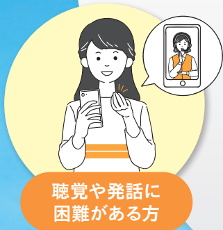
聴覚や発話に 困難がある方